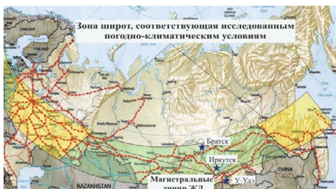
Рис. 2. Исследованные климатические и природные зоны эксплуатации РЖД

разцов, изготовленных из сепараторов из полиамида «Армид» различных заводов-изготовителей.